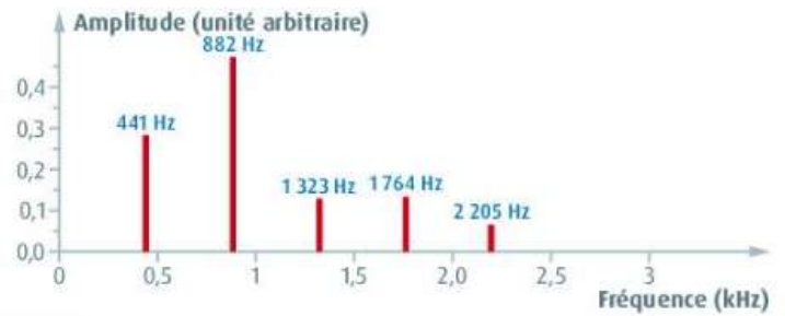
DOC 2 Spectre du La 3 joué par la clarinette.