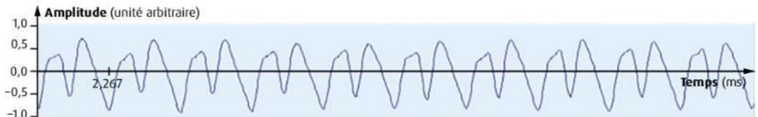
DOC 1 Oscillogramme du La 3 joué par la clarinette.

Une clarinettiste n'est pas sûre que son instrument soit bien accordé. Pour le vérifier, elle utilise deux méthodes : l'analyse de l'oscillogramme et l'analyse du spectre du La3. Si la clarinette est accordée, la fréquence fondamentale de cette note devrait être de 440 Hz.